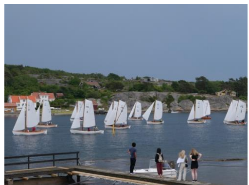
Fra 125 års Jubileumsregattaen. FS 24 «Sandø» tok en fin 5. plass